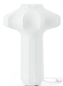
Phantom Table Lamp H: 43 x Ø: 29,5 cm