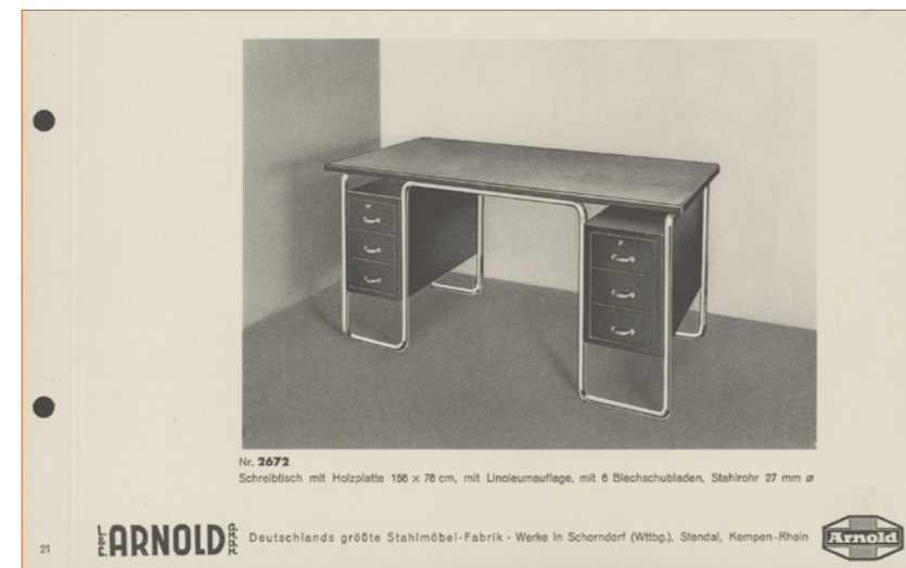
Abbildungen aus dem Arnold-Katalog von 1929/30.