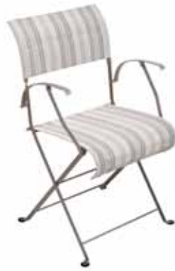
I402 Folding armchair Klappbrücke