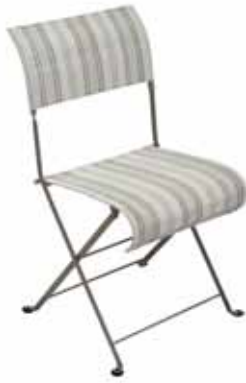
I301 Folding chair Klappstuhl

Registered trademark Exklusives patentiertes Modell