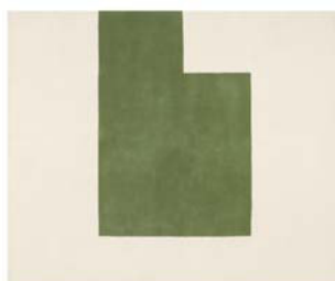
KILKENNY 1925 - 1935