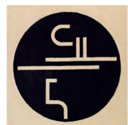
ST. TROPEZ 1925 - 1935