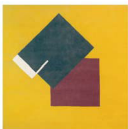
CASTELLAR 1925 - 1935