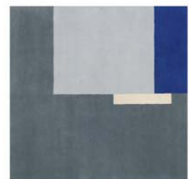
ROQUEBRUNE 1925 - 1935