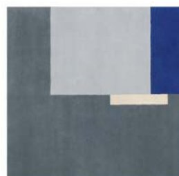
ROQUEBRUNE 1925 - 1935