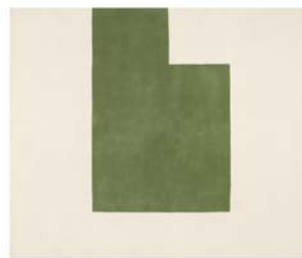
KILKENNY 1925 - 1935