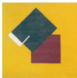
CASTELLAR 1925 - 1935