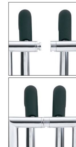
athos als Stahlrohr-Vierbeiner.

Die Reihenverbindung bietet schnelle Handhabung und sieht zudem sehr elegant aus.