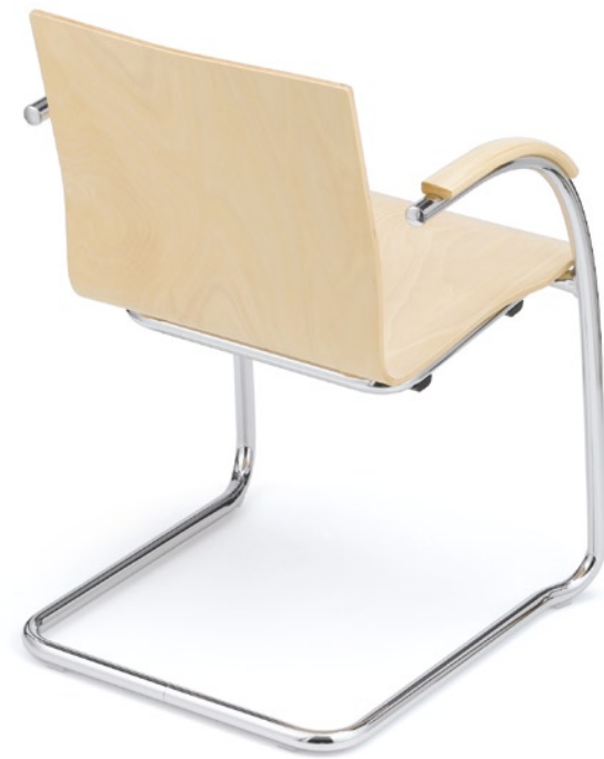
Der klassische Konferenz- oder Besucherstuhl: athos als Freischwinger.